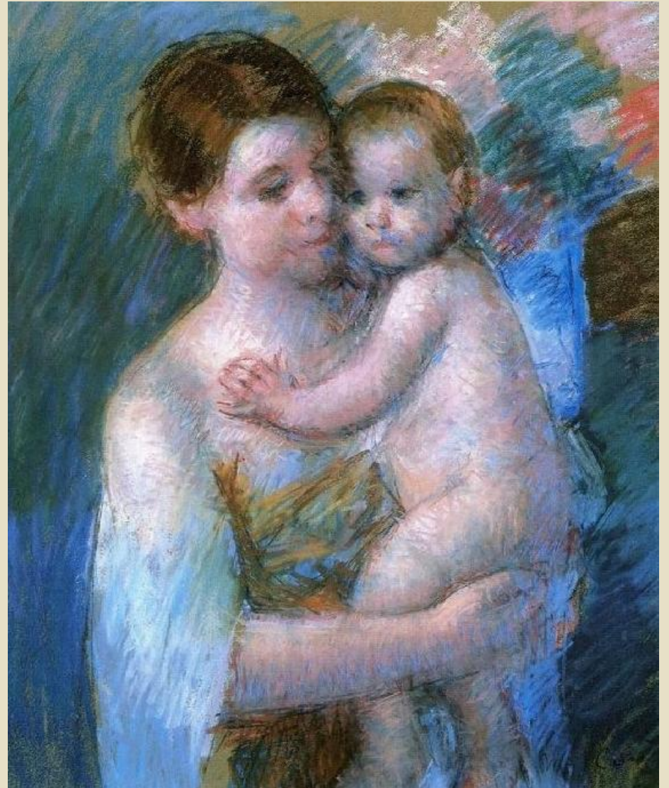
Mary Cassatt: Mother and son (1900)